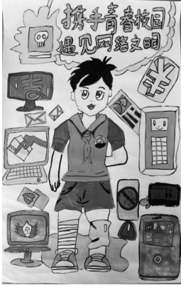
上虞区崧厦街道中心小学三(6)班 刘恬汐 指导老师 王翡