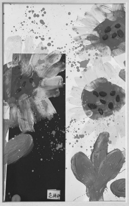
上虞区崧厦街道中心小学一(5)班 范梓泮 指导老师 王小英