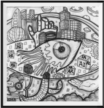
上虞区崧厦街道中心小学三(6)班 姜语涵 指导老师 王翡