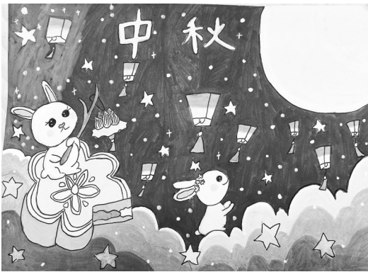
上虞区崧厦街道中心小学四(3)班 潘艺萱 指导老师 王华萍

湖南博物馆是国家一级博物馆。湖南博物馆内珍藏着世界上最古老的湿尸,让游客趋之若鹜。妈妈特意请了老师给我们讲解,在老师的引导下,我们来到了三楼——马王堆文物展。首先映入眼帘的是辛追夫人棺槨上帛画的天界部分,表现古人追求永生的境界。随着人潮,我们参观了辛追墓出土的各种漆器,它们红