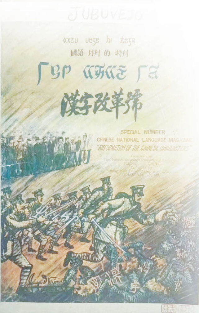
《国语月刊》特刊《汉字改革号》。

5月13日，《新青年·新觉醒——纪念〈新青年〉杂志创刊110周年》特展在绍兴鲁迅纪念馆开展。本次展览由北京鲁迅博物馆、绍兴市文史研究馆和市文旅集团主办，分“点燃新文化的火炬”“吹响新时代的号角”两个板块，以史料、图片、文物等形式生动再现了新文化运动及五四运动的背景、历程与意义。