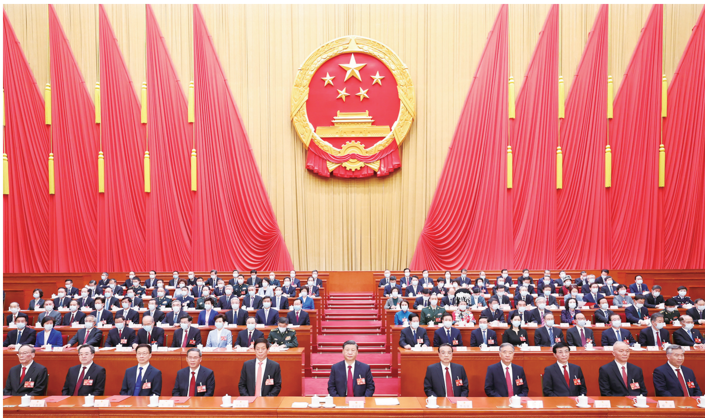
3月13日，第十四届全国人民代表大会第一次会议在北京人民大会堂闭幕。中共中央总书记、国家主席、中央军委主席习近平发表重要讲话。